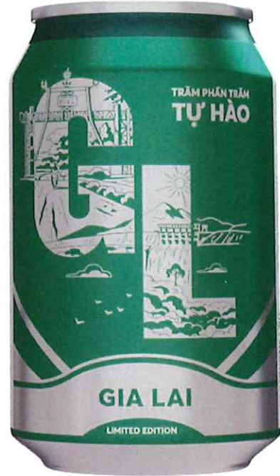
Mặt sau/ Back