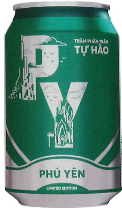
Mặt sau/ Back