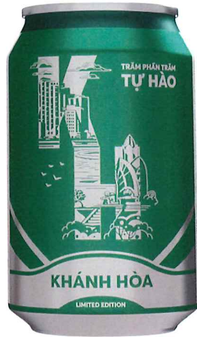
Mặt sau/ Back