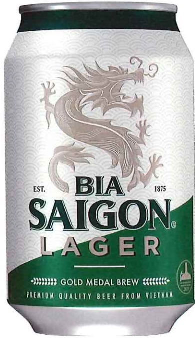
Mặt trước/ Front