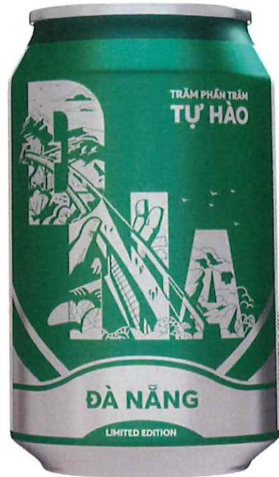
Mặt sau/ Back