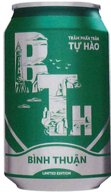
Mặt sau/ Back