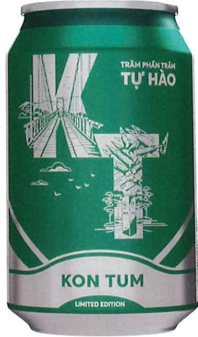
Mặt sau/ Back